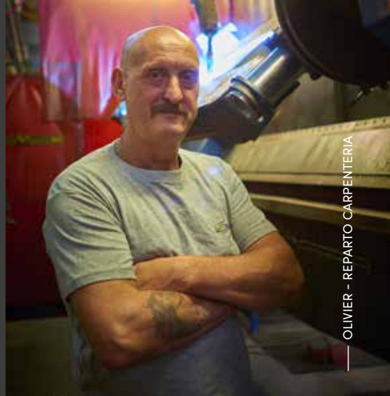
— OLIVIER - REPARTO CARPENTERIA