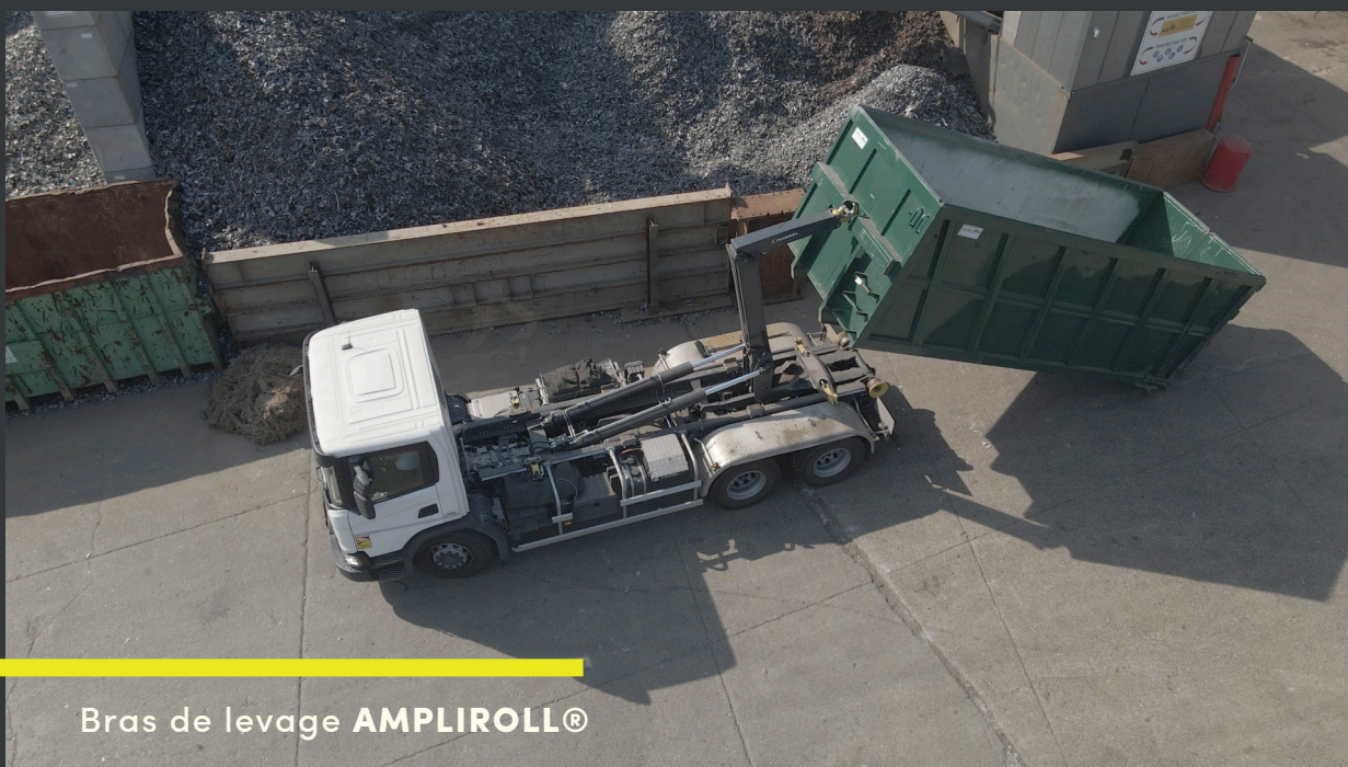
Bras de levage AMPLIROLL®

Ils sont à l'origine de tous nos équipements... et bien plus !