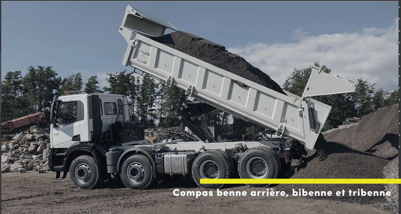
Compas benne arrière, bibenne et tribenne